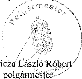
Gyuricza László Róbert polgármester

Felelős: Gyuricza László Róbert polgármester