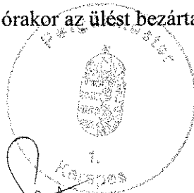
Franka Tibor polgármester

Franka Tibor 17:13 órakor az ülést bezárta és zárt ülést rendelt el.