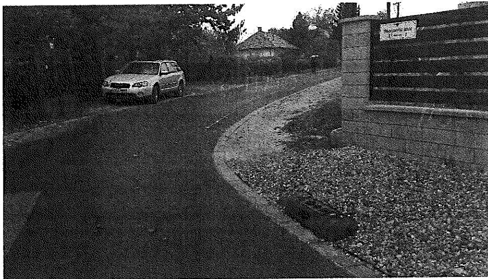
Helyszínen készített fénykép a kerítés sarokkal, Tölgyfa utcával