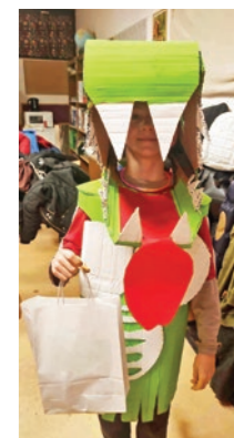
Egy ötletes jelmez a felsősök farsangján

jelmez a DÖK zsűrije egy kis ajándékos-maggal jutalmazta.