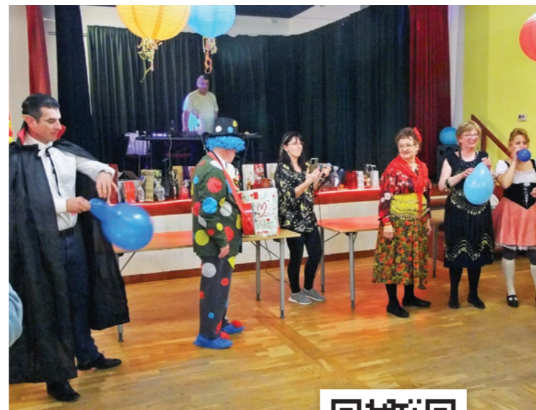
A jelmezes versenyrésztvevői