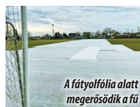
A fátyolfólia alatt megerősödik a fű

elősegíti a fű növekedését. A pálya karbantartásával is igyekszik az egyesület az új klubházhoz méltó körülményeket teremteni.