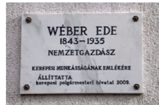
A felújított emléktábla

lett magyar hazafivá és a modern magyar mezőgazdasági fejlődés jelképévé vált. Felesége, Micheline Laura révén költözött Kerepesre, ahol egy elhanyagolt 124 holdas birtokon – gyümölcsöst és szőlőt is telepítve – 3 év