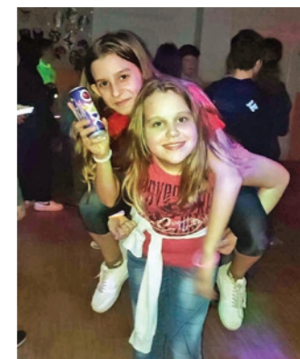
Farsangi sulibulit szerveztek a felsősöknek

és felső tagozatos tanulók más-más tematika szerint öltöztek be a hét napjain. A farsangi hét utolsó tanítási napján, pénteken – a hét lezárásaként – piros öltözetben, kedvenc plüssállatukkal vonultak a gyerekek egyik helyről a másikra. A farsangi vidámság megkoronázásaként hagyományosan minden évben, ezen a napon a DÖK sulibulit szervez a felsősöknek, amelyre a 4. évfolyam tanulóit is kivétel nélkül meghívják. Az elmúlt évek tapasztalata, miszerint ez az egész évben a legsikeresebb sulibuli, ezúttal is beigazolódtott. A tanulók nagy része jelmezben érkezve szórakozhatott a korosztály számára legnépszerűbb dalok kíséretével. Öröm volt látni, hogy a gyerekek kifejezetten igényelték, és élvezték a napjainkban népszerű slágerek mellett a retró slágereket is. Talán a buli fénypontja a Limbó hintó volt, amely kihagyhatatlan eleme minden sulibulinak. A buli közben a legötletesebb, legjobban elkészített négy