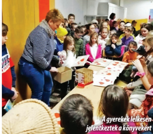
A gyerekek lelkesen jelentkeztek a könyvekért