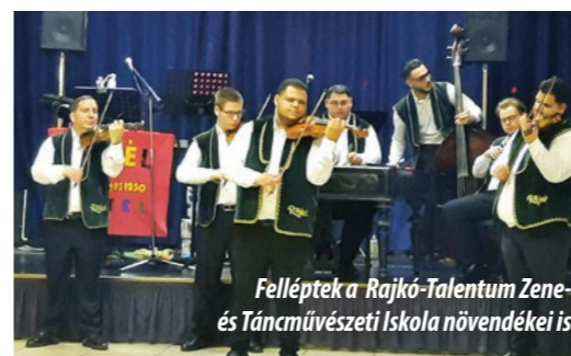
Felléptek a Rajkó-Talentum Zene- és Táncművészeti Iskola növendékei is

A vacsora után rendezték meg a jelmezes versenyt, ahol minden maskarába öltözött gyermek és felnőtt ajándékot kapott. Az este további részében tombolasorsolás fokozta az izgalmakat, a szerencsések értékes ajándékokat nyertek. Az est nagyon jó lehetőség volt a találkozásra, a beszélgetésre és a közösség megerősítésére.