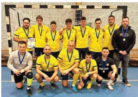
Az ezüstérmet szerzett futsalcsapatunk