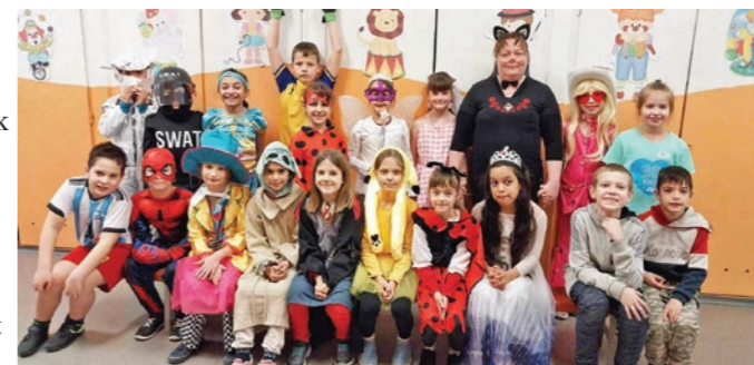
Nagyon aktív volt a 2.b osztály is

Péntek délelőtt a tanítási órák is a farsang jegyében zajlottak. Az osztályfőnökök olyan órai