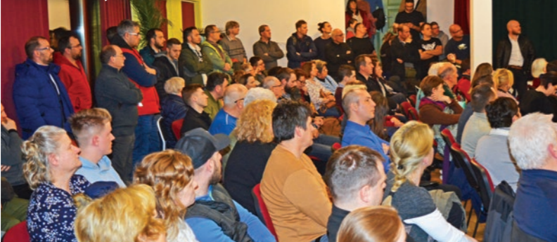
A hozzászólók elutasították a bemutatott nyomvonalat

Minisztérium szakembereit egy érdemi tájékoztatásra.