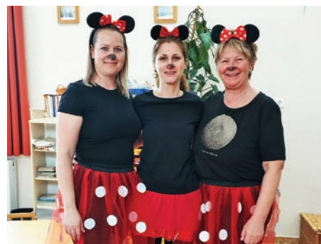
A Csicsergő Óvoda Mókus csoportjának jelmezbe öltözött óvodapedagógusai