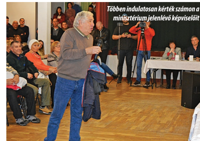
Többen indulatosan kérték számon a minisztérium jelenlévő képviselőit

hozzátette, hogy ennek az útnak az előkészítése nemzetgazdasági szempontból kiemelt beruházásnak számít. Ez azt jelenti, hogy a beruházás előkészítésekor megvizsgálják – környezetvédelmi és építési enge-