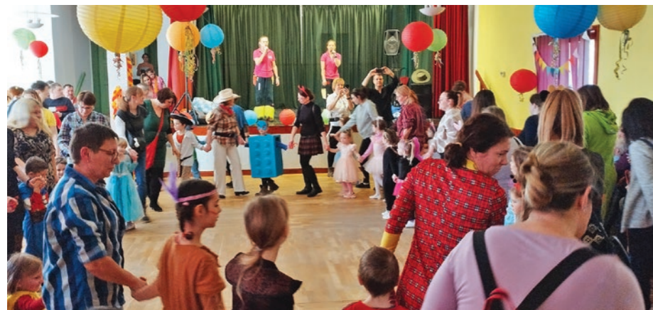
A Meseliget Óvoda a művelődési házban tartotta a farsangot