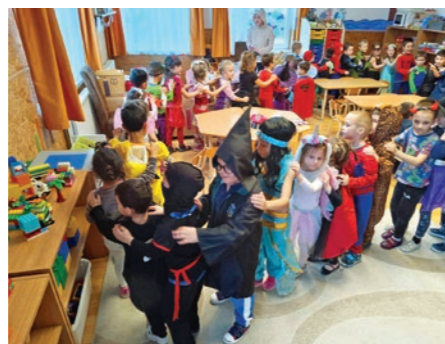
Szivárvány Óvoda farsangja

A TÜV közreműködésével januárban megtörtént a játszódvarkon található játékeszközök háromévenként kötelező felülvizsgálata. A javításra szoruló eszközeink munkálatainak megrendelése már folyamatban van, annak érdekében, hogy tavasszal a gyerekek újra biztonságosan használhassák a játékeinket.