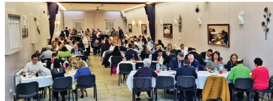
A Royal Stationban rendezték a bált

A hústól való tartózkodás nem önmagában tekinthető böjti cselekménynek. A hús fogyasztása az ókori, középkori ember számára ritka, ünnepi alkalomnak számított, vagyis az erről való lemondás valóban a bánat és az önmegtartóztatás kifejezőeszköze volt.