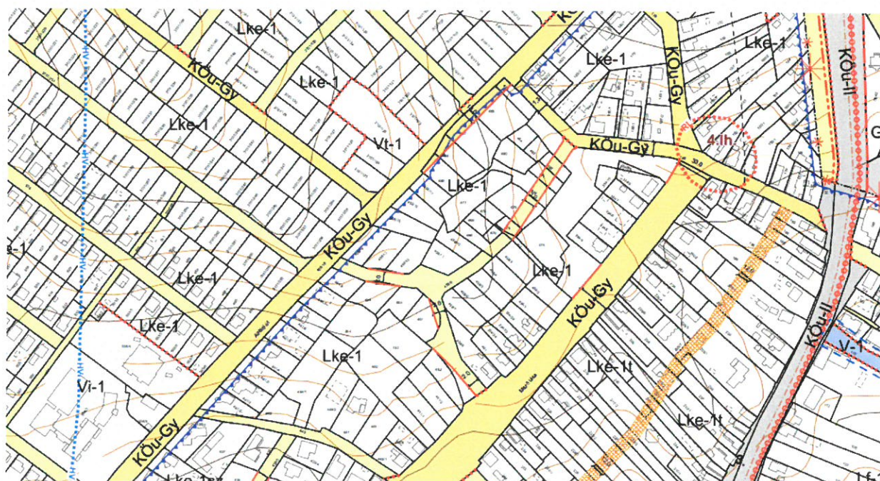
Szabályozási Terv kivonat

Kerepes Város Önkormányzat Képviselő-testületének többször módosított, egységes szerkezetbe foglalt 23/2014.(XI.18.) önkormányzati rendelete Kerepes Város Helyi Építési Szabályzatról (továbbiakban: HÉSZ) térképszelvénye tartalmazza az önkormányzat által kialakított kellő szélességű utakat, melyek jelölése piros vonallal ábrázolt.