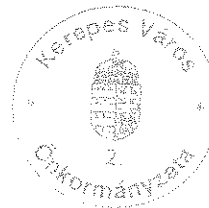
Franka Tibor polgármester

Az előterjesztés ellen törvényességi kifogást nem emelek.