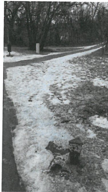
3. ábra Kábelaléptmény helye