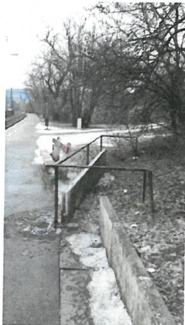
2. kép Szilasliget kamera helye 2