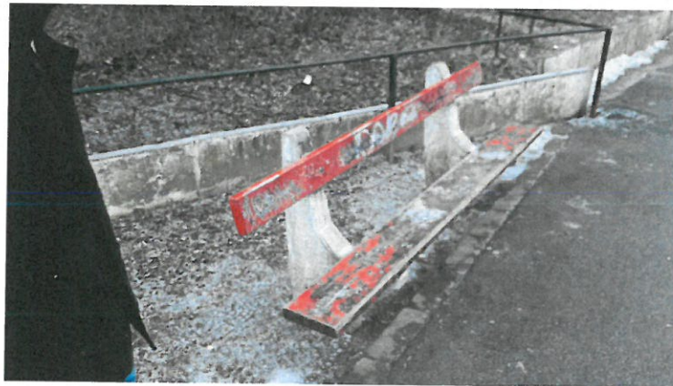
1. kép Szilasliget kamera helye 1