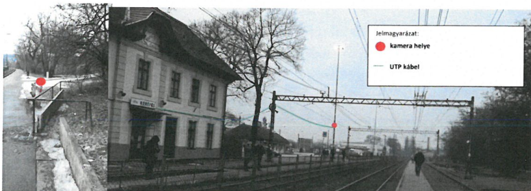
4. kép Kerepes állomás kamera

A kamera és a kábelek kiépítése (földmunka, bekötés, stb.) csak szakfelügyelet mellett lehetséges, amelyet a MÁV-HÉV Zrt. biztosít előre egyeztetett módon. A kiépítéshez szükséges tulajdonosi és üzemeltetői hozzájárulásokat MÁV-HÉV Zrt. kiadja a kiépítéshez szükséges dokumentumok rendelkezésre állásakor (műszaki terv a kábelbekötésről). A kamera üzemeltetéséhez szükséges villamos energia betápláláshoz energiatovábbadási szerződést kell kötni, amelyhez külön egyeztetés szükséges.