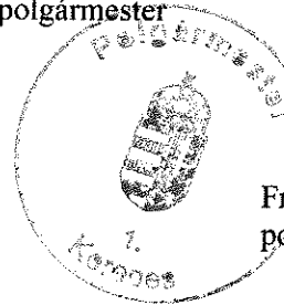
Franka Tibor polgármester

Az előterjesztés ellen törvényességi kifogást nem emelek.