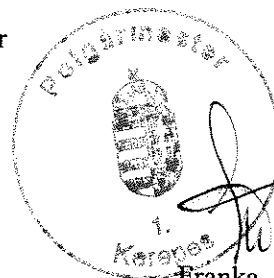
Franka Tibor polgármester

Az előterjesztés ellen törvényességi kifogást nem emelek.