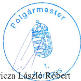
Gyuricza László Róbert polgármester

Felelős: Gyuricza László Róbert polgármester