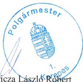
Gyuricza László Róbert polgármester

Felelős: Gyuricza László Róbert polgármester