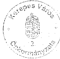
Franka Pál Tibor polgármester

Az előterjesztés ellen törvényességi kifogást nem emelek.