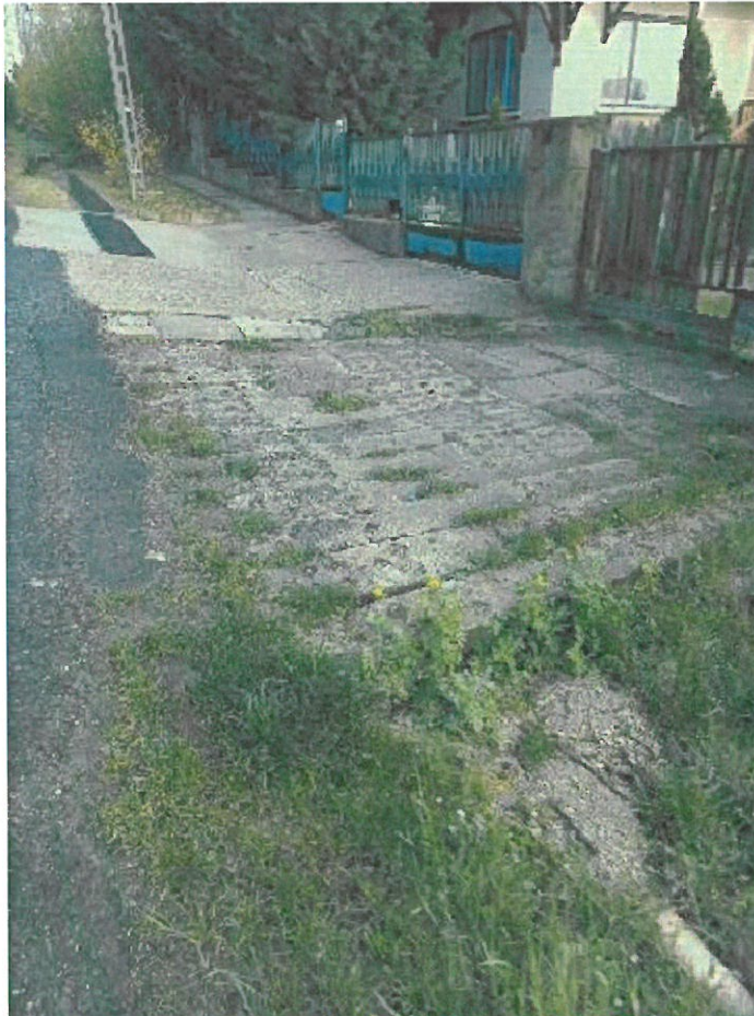
Kerepes, Kodály Z u_3.