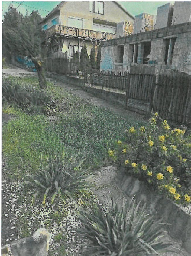
Kerepes, Kodály Z u_5.