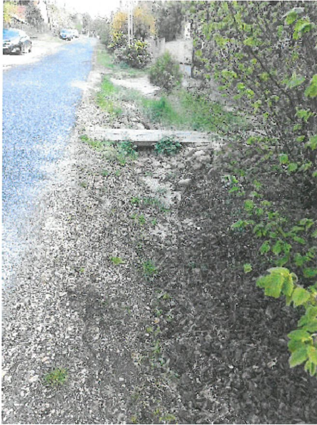
Kerepes, Kodály Z u_4.