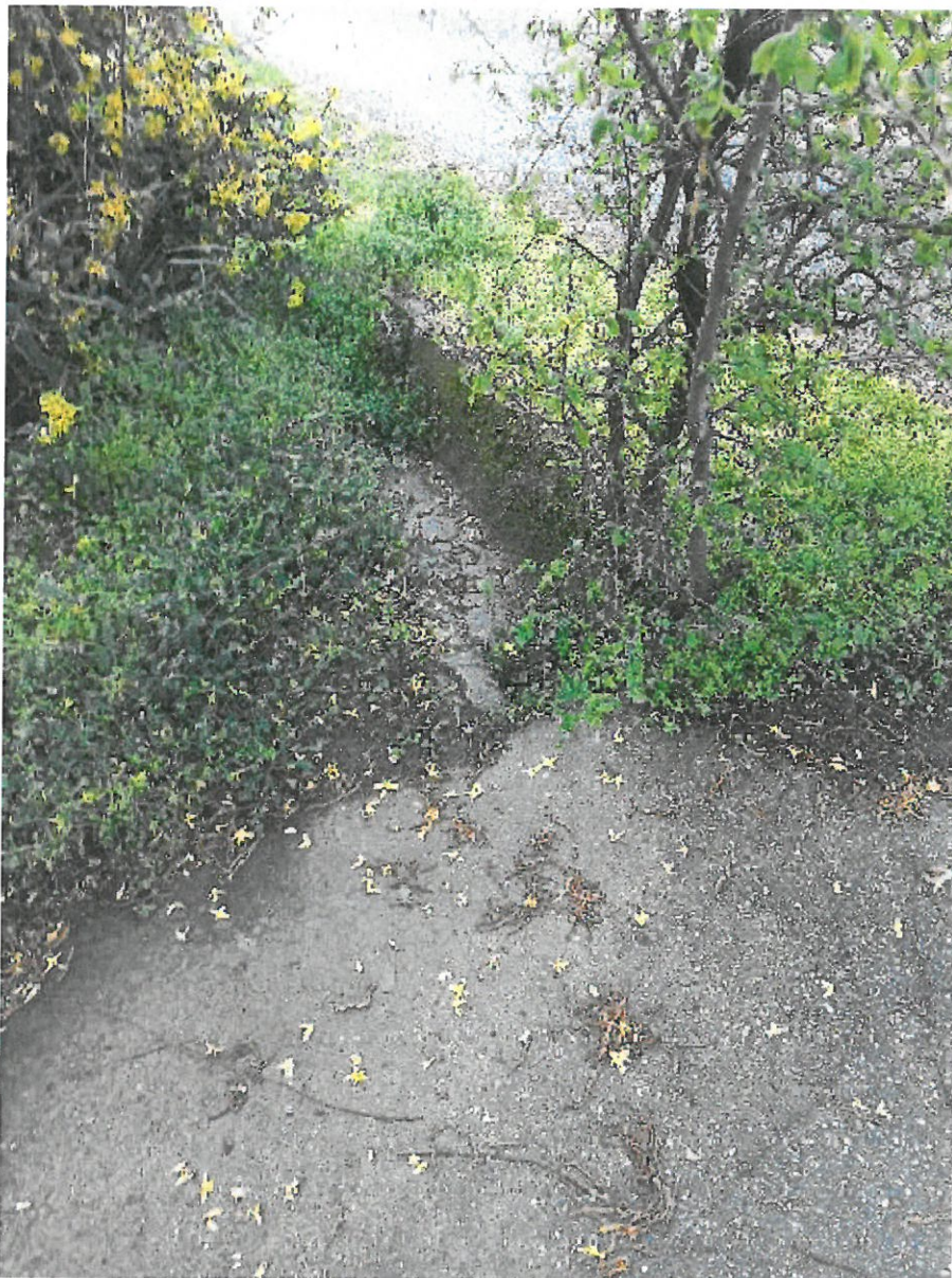
Kerepes, Kodály Z u_1