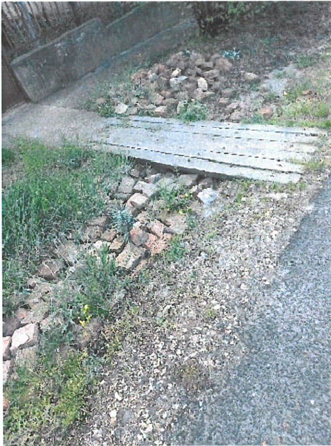
Kerepes, Kodály Z u_2