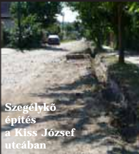
Szegélykő építés a Kiss József utcában