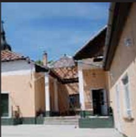
Faluház teljes felújítása