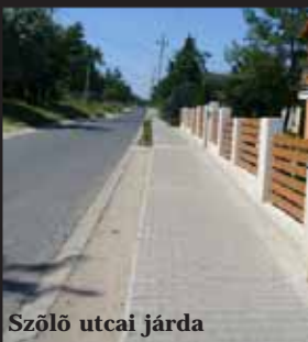
Szőlő utcai járdá